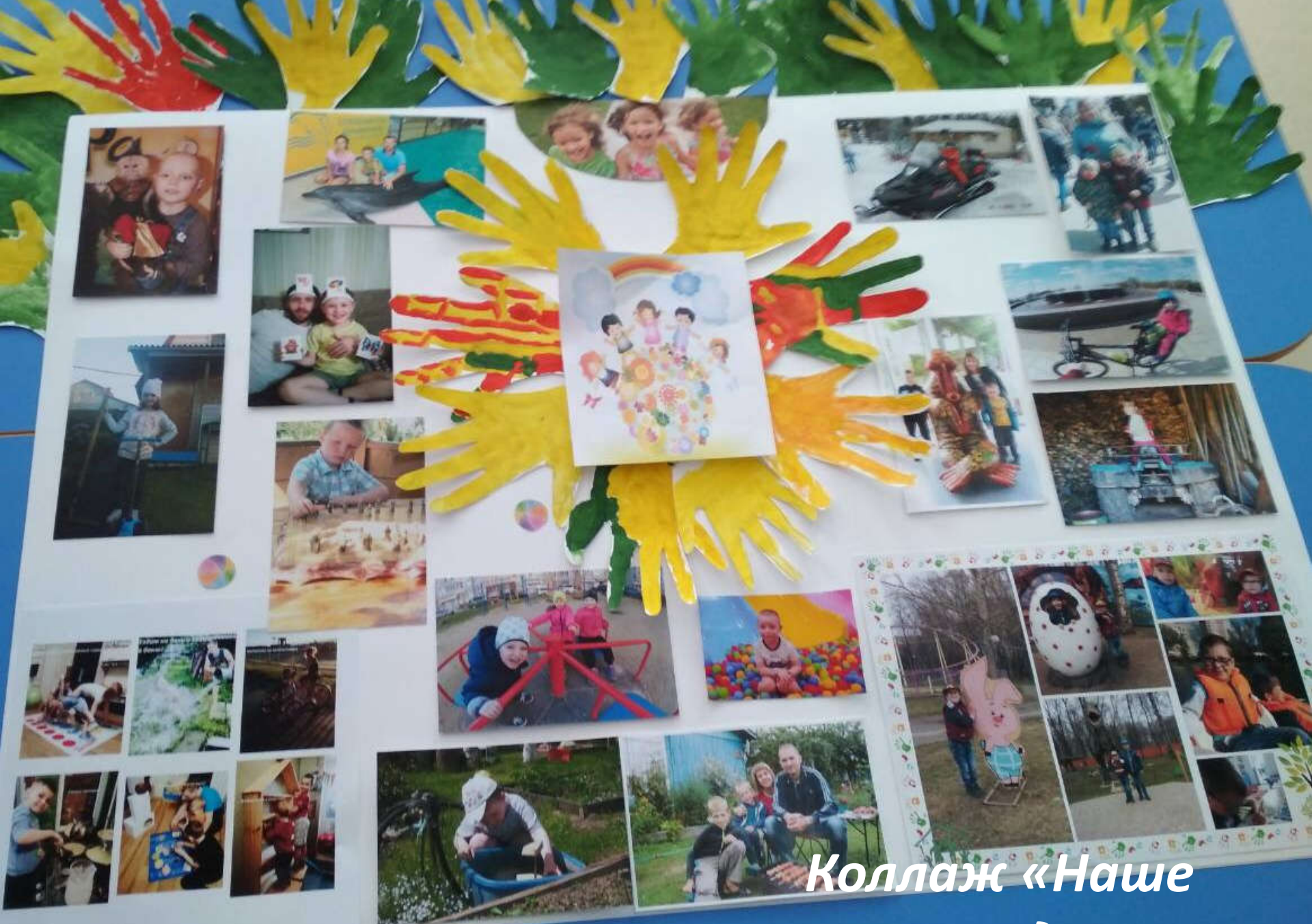
Коллаж «Наше счастливое детство»